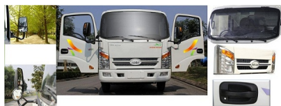
Cabin kiểu dáng hiện đại